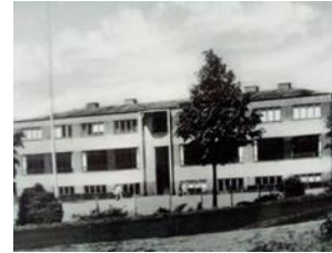
Vores skole fra 3. til 7.klasse i Gauerslund